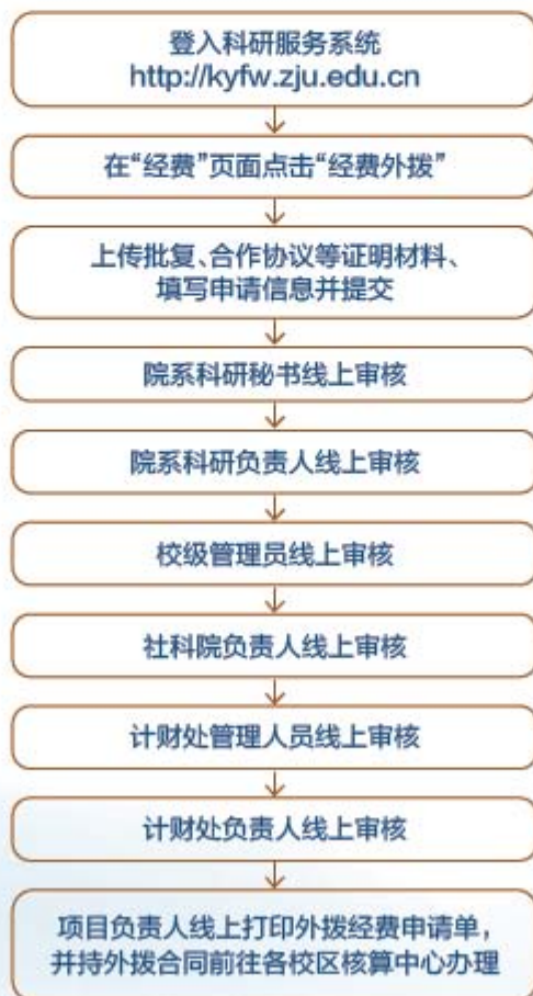
科研经费外拨流程图