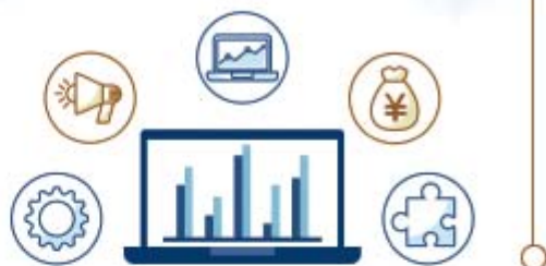
绩效费用发放流程图

在科研服务系统中提出绩效费发放申请,经学院和社科院审核通过后,前往财务系统办理发放事宜。